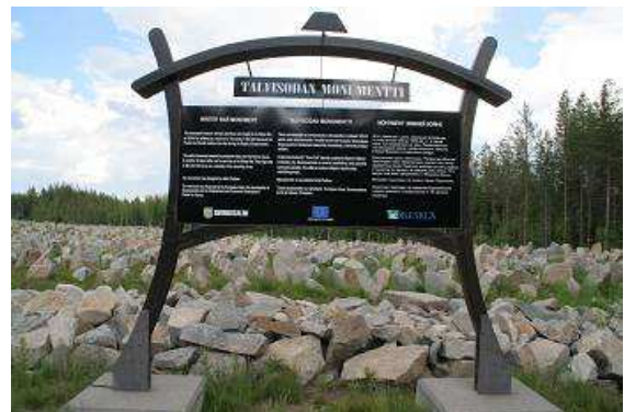
Mahn- und Gedenkstätte gegen Kriege

Nahe Suomussalmi schauen wir uns die Gedenkstätte für die Gefallenen des Winterkrieges 1939/40 an. Für jeden gefallenen Soldaten liegt hier ein Stein, 150 Glöckchen klingen im Wind, für jeden Kriegstag eines. Sie sollen mit ihrem Klang die Sinnlosigkeit von Kriegen anmahnen.