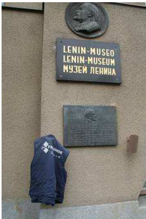
Eingang zum Lenin-Museum in Tampere

sich manch Einer fragen, aber genau darüber gibt ein Raum der Ausstellung Auskunft. Der andere Raum ist dem Leben Lenins, seiner Arbeit und Kampf gewidmet. Einen Teil seines Lebens befand sich Lenin auf der Flucht, dann organisierte er von diesem Haus in Tampere zum Beispiel die Herausgabe von Zeitungen, Schreiben und den Widerstand in Russland.