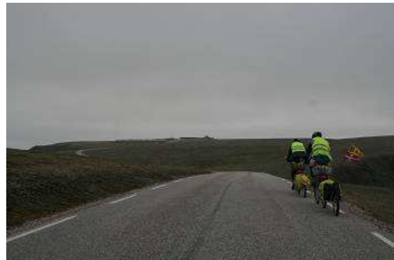
Trostlose Landschaft mit Radfahrer und der Nordkapphalle im Hintergrund

Zweihundert Meter vor dem Ziel gibt es natürlich noch einmal eine Mautstelle, hier zahlt man pro Person etwa 35 Euro Eintritt, dafür darf man zwei Tage lang sooft