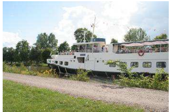
Schon morgens herrscht reger Betrieb auf dem Kanal

vorbei, diesmal sind wir die Exoten, etliche Kameras sind auf uns gerichtet, die Verschlüsse klicken, alle wollen ein Bild von unserem Wartburg mit dem Zelt auf dem Dach und den Touris beim Frühstück davor.