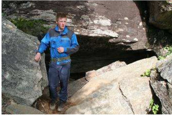
Eingang zur Grönli Grotte mit Führer

In sehr gutem Englisch erklärt er uns die eigentlich unerklärliche Entstehung der Höhle und die noch unerklärlichere Anwesenheit eines riesigen Granitblocks im Innern, eng umschlossen von dem sonst vorherrschendem Kalkstein. Die Grotte, 1200 Meter lang, und am Ende ist der eben beschriebener Granitkoloss zu sehen. Die Wege sind wirklich sehr rutschig und unser Guide hat alle Hände voll zu tun, seine ihm anvertrauten Gäste heil wieder hinauszubringen.