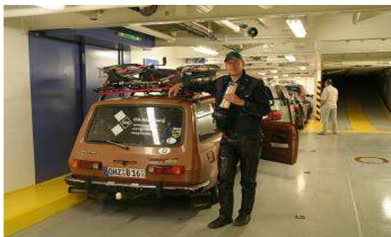
Im Parkdeck der Fähre „Superfast“

Es wird 0:30 Uhr, bis wir endlich in den Bug der Fähre einfahren, Stück für Stück geht es vorwärts, dann weiter nach unten, dem Einweiser gehorchend, dreimal vor, viermal zurück, so, jetzt ist es richtig, so kann der Wagen stehen bleiben. „Bitte die