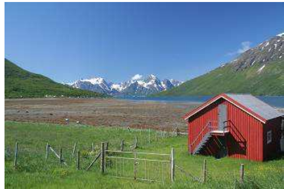
Immer noch weit nördlich des Polarkreises

Nach einem guten Frühstück in der Sonne schießen wir noch ein paar Bilder vom Fjord und dessen Landschaft ringsum, dann brechen wir auf. Zweimal fahren wir mit einer kleineren Fähre, jedes Mal etwa