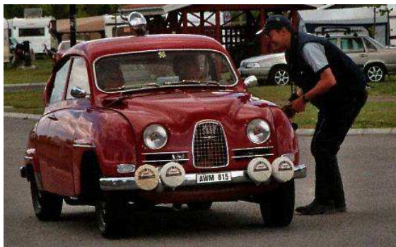
endlich; ein zweitaktender Saab

In der Nähe liegt mit 91,5 Metern der höchste Punkt des Kanals, aber auch direkt am Kanal ein sehr schöner Campingplatz. Hier werden wir die nächsten zwei Tage bleiben. Doch bevor wir auf den Platz fahren entdecken wir einen roten Saab, der sieht noch richtig klassisch aus und bei näherem Hinsehen ist es tatsächlich endlich einer mit Zweitaktmotor!