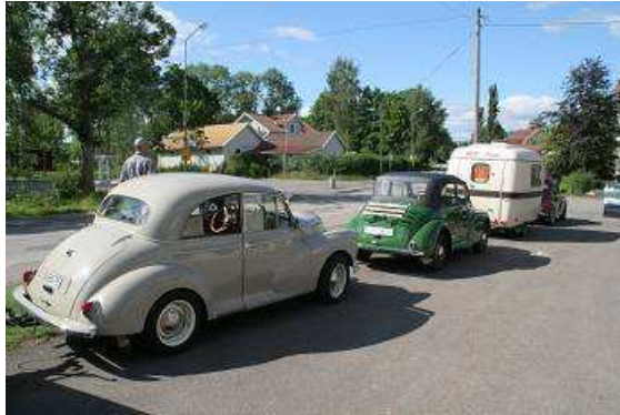
Englische Kleinwagenparade in Forsvik

Auf beiden Bikes ist der Sozius ebenfalls besetzt, doch nachdem Fahrer und Fahrerin absteigen, bleiben die hinteren Sitze belegt. Das wundert uns ein wenig, wenn wir mit dem Motorrad unterwegs sind, steigt Marlo als Sozia immer zuerst ab. Bei genauerem Hinsehen, handelt es sich bei beiden um Kinder, schätzungsweise vier bis sieben Jahre alt. Der Kleinere hat einen Kindersitz auf der Sitzbank befestigt, die Größere kann schon so bei Mutti mitfahren! Beide Eltern erfüllen voll und ganz das typische Bild des amerikanischen Chopperfahrers auf dem Highway, bei der Unterhaltung entpuppen sie sich aber (wie meistens) als sehr freundliche Menschen. Ja sagt er, hier in Schweden darf man eh nicht sehr schnell mit dem Motorrad fahren, da ist es egal, ob da noch ein Anhänger dran ist.