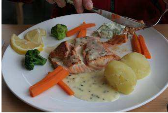
Frischer, sehr gut zubereiteter Lachs

und Gemüse. Hat sehr gut geschmeckt und nach unseren ausgiebigen Nudeltagen war dieses Menü eine willkommene Abwechslung. Gut gestärkt und schlauer, was die Lachse angeht, unternehmen wir noch eine kleine Wanderung auf einem Lehrpfad am Ufer des Flusses entlang und fahren dann weiter nach Trondheim. Leider ist auch in dieser großen Stadt um 17 Uhr alles geschlossen. So besichtigen wir die prächtige Westfassade des Nidaros Domes, haben sehr schönes Licht zum fotografieren, dann halten wir uns aber nicht länger in der Stadt auf. Es ist sehr schönes warmes Wetter, alles scheint auf den Beinen zu sein, jedes Straßencafé ist bis auf den letzten Platz besetzt. Unser Wartburg wird teils bestaunt, teils auch etwas abwertend belächelt. Nun nach all den Kilometern und Anstrengungen sieht er etwas dreckig und mitgenommen aus, tut aber sehr zuverlässig seinen Dienst, auch mit fremder Zündspule.