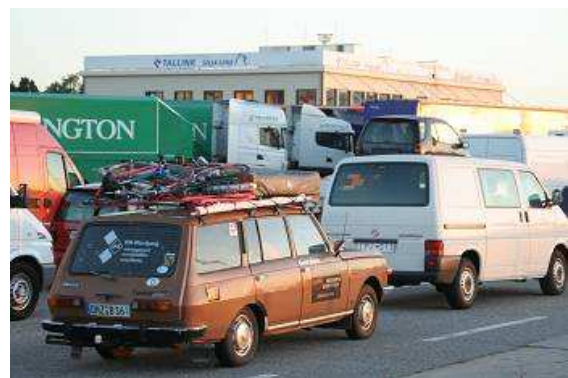
Im Hafen von Rostock

Augen so spartanischen Ausrüstung auf eine so große Reise begeben. Ein Wagen aus Gütersloh überholt uns, als sich der Stau langsam auflöste, die hinten sitzenden Kinder wollen schnell einige Fotos schießen. Ich stecke meinen Kopf aus dem Fenster, winke freundlich, alles so lange bis genug Bilder im Kasten sind und nehme natürlich aus Gewohnheit die falsche Abfahrt, A24 in Richtung Berlin. Also die nächste raus, Frau GARMIN redet schon ganz aufgeregt von wenden und so, weiter geht die Fahrt über Lübeck, dann die A20 nach Rostock. Das Wetter ist durchwachsen, mal Sonne, mal Regenschauer. Gegen 19 Uhr sind wir in Rostock am HEROS Markt, da gibt es nur beste Waren aus der Produktion noch lebender Unternehmen aus der nicht mehr lebenden DDR. Also noch einmal Großeinkauf von diversen leckeren Fertigen in der Büchse, Schokolade, Knabberspaß und noch zwei Flaschen Wein für die langweiligen Abende an Bord der Fähre. Den Tank befüllen wir mit Shell super gemischt mit gutem Zweitaktöl. In „Uschis Restaurant“ essen wir zu Abend, noch einmal gutbürgerliche deutsche Küche. So gestärkt fahren wir zum Fähranleger im Überseehafen.