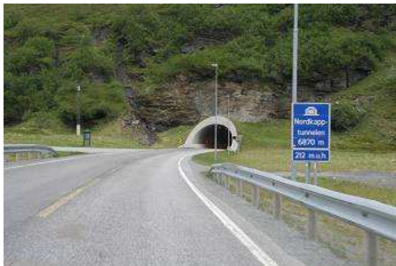
Einfahrt zum Nordkaptunnel

hier im Norden wesentlich weiter voneinander entfernt. Nun hinein in den Tunnel, 3,5 km immer 7% bergab, dann