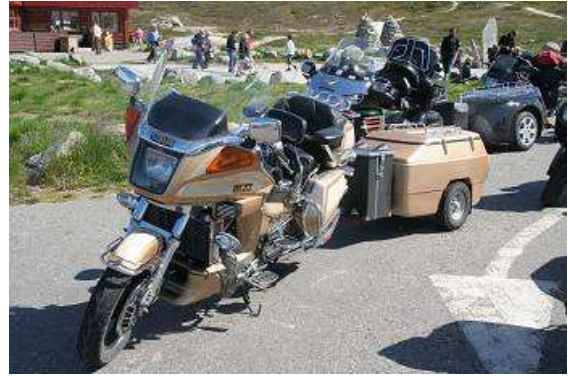
Bikes mit Anhänger sind in Skandinavien sehr beliebt

Wir lassen uns ein Eis schmecken, dann schauen wir uns auf dem Parkplatz die vielen Motorräder an, die heute unterwegs sind. Neben der normalen Solomaschine ist es in Skandinavien üblich und sehr beliebt, einen Anhänger am Bike mitzuführen. Dabei reicht das Spektrum vom normalen Minimotorradanhänger über PKW-Anhänger verschiedener Größen bis zum Miniwohngewagen, was da so alles an der Kugel hängt. Auch die Befestigung der Anhängerkupplung am Motorrad zeigt verschiedene Qualitäten und sind meist handgefertigt. Auch die zugehörigen Motorräder haben entsprechende Größe, sehr beliebt sind „Gold Wing“, BMW LT und ähnliche Luxustourer. Auf einem großen freien steinigen Feld hinter dem Polarkreiszentrum gibt es unzählige Steintürmchen und Türme,