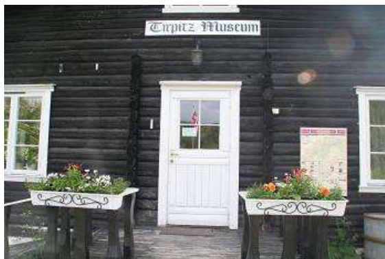
Tirpitz Museum nahe Alta

Wir umrunden noch so manchen Fjord bis wir nahe Olderdalen auf einem kleinen hübschen Camping übernachten. Dort treffen wir auch das holländische Pärchen mit ihren Motorrädern, sie haben hier eine