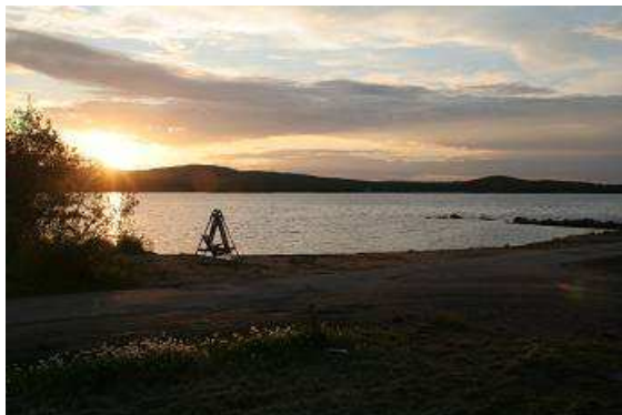
Mitternacht bei 24° Celsius am Inarisee

Wir übernachten auf einem schönen Camping direkt am See und nehmen unseren Minigrill in Betrieb.