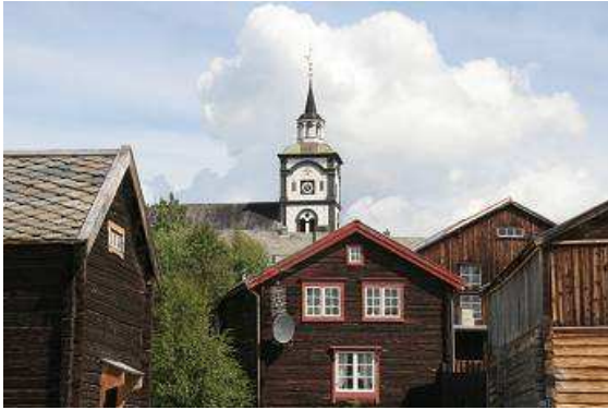
Røros in Norwegen erinnert mich an Johanngeorgenstadt im Erzgebirge

gestalteten Hofcafé lassen wir uns nieder, genießen das Sommerwetter, den guten Kaffee, selbstgebackenen Kuchen und andere Köstlichkeiten. Am Wegesrand treffen wir noch einen Oldtimer, der scheinbar schon lange vergessen ist; ein VW Käfer mit Skiern auf dem Dach!