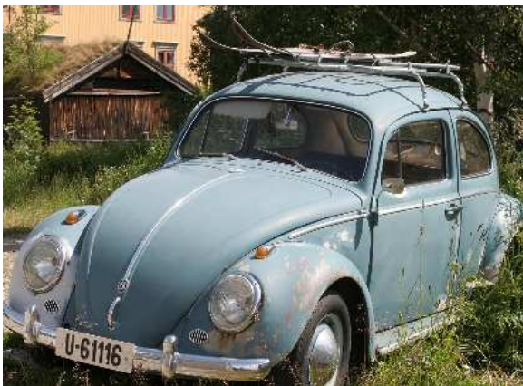
Dieser Käfer steht wohl schon ein paar Tage!

gestalteten Hofcafé lassen wir uns nieder, genießen das Sommerwetter, den guten Kaffee, selbstgebackenen Kuchen und andere Köstlichkeiten. Am Wegesrand treffen wir noch einen Oldtimer, der scheinbar schon lange vergessen ist; ein VW Käfer mit Skiern auf dem Dach!