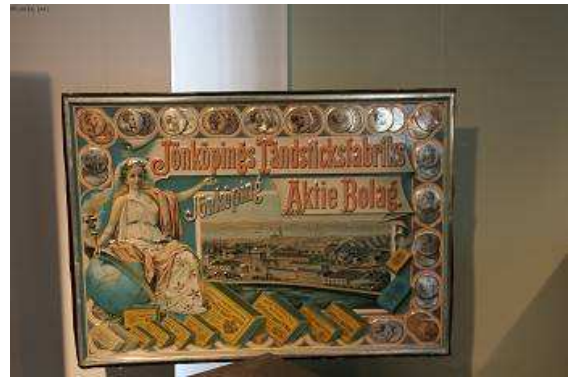
Blechwerbeschild einer Zündholzfabrik

Weiter geht es Richtung Süden, bei Landskrona steuern wir das letzte mal einen schwedischen Campingplatz an, auf der Fahrt dorthin durch einsame Wälder an den Ufern schöner Seen entlang sehen wir in einem Dorf tatsächlich eine „Trabant“ mit schwedischem Kennzeichen auf einem Bauernhof! Sofort mache ich kehrt, stelle