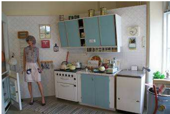
Auch das sind Produkte aus dem Hause Husqvarna

Ein kurzes Stück weiter kommen wir in Jönköping am Strichholzmuseum an. Das