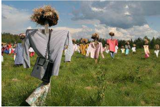
Hiljaiven Kansa“- das Stille Volk

Halbjährlich wird das Outfit gewechselt, immer dann, wenn die Jahreszeit es erfordert. Schließlich soll das Volk weder Frieren noch Schwitzen. Gleich daneben ist eine sehr rustikale Freiluftgaststätte errichtet, hier gibt es Kaffee, Pfannkuchen (Omelett) und anderen Kuchen, alles auf dem Holzfeuer oder im Holzofen zubereitet. Wir laufen etwas zwischen den „Püppchen“ hin und her, amüsieren uns über so manches Kleidungsstück oder Accessoire aus längst vergangenen Zeiten. In der Ferne höre ich ein sehr vertrautes Geräusch, sehr zweitaktend, aber eher von einem Motorrad, aber auch nicht wie eine MZ oder JAWA. Es ist eine russische ISCH, die, liebevoll restauriert mit einem schon etwas betagtem Fahrer auf den Parkplatz einbiegt. Eine kurze Unterhaltung, ein Foto, dann die Motorhaube auf und das 50PS Aggregat des „Wartburg“ wird angeschaut.