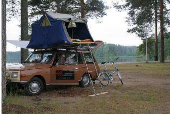
Unsere erste Übernachtung in Finnland