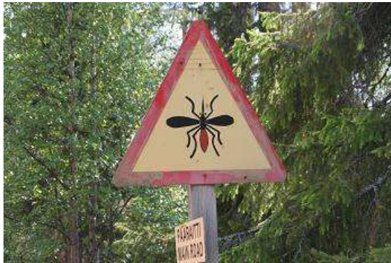
Keiner soll sagen, er wäre nicht gewarnt worden!

chromblitzenden Autos und Monaco, mit sich, ihrer Schüssel und den eventuell zu findenden Nuggets beschäftigt. Sie alle kommen dann mit total zerstochem Gesicht und Händen meist ohne Gold von „ihrem“ Waschplatz zurück.