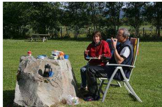
Frühstück in der Natur

bestehend aus kleinen Holzhäusern und oberhalb des Ortes die alten Förderanlagen für Kupfer nebst den riesigen Abraumhalten. Wir schlendern durch die Straßen, viele sind Fußgängerzone, und außer uns sind an diesem Tag noch eine Menge Touristen und Einheimische unterwegs, die alle das herrliche Sommerwetter mit Temperaturen weit über 20 Grad genießen.