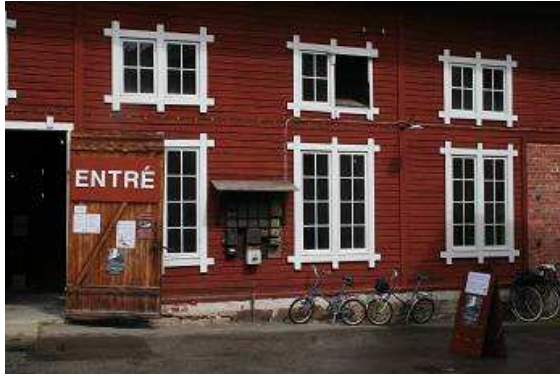
Eingang zum Maschinenmuseum Forsvik mit unseren Minifahrern

Industrie im 19 und beginnenden 20. Jahrhundert. In einer besonders großen Halle wird der Raddampfer „Nordevall“ nachgebaut. Das Original liegt ziemlich gut erhalten, auf dem Grund des Vätternsees. Den Schweden muss dieser Dampfer sehr viel bedeuten, es gab schon etliche Tauchgänge zu ihm, auch Pläne, das Teil zu heben wurden schon geschmiedet. Der kühnste Plan war wohl, den Dampfer mit einer riesigen gläsernen Hülle zu umgeben und per Fahrstuhl von der Oberfläche des Sees für Interessierte und natürlich Touristen zugänglich zu machen. All diese Pläne sind gescheitert, der Dampfer bleibt, wo er ist, nämlich auf dem Grund des Sees und die Nachwelt wird mit einer originalgetreuen Kopie befriedigt. Bei den Erbauern der Kopie handelt es sich um einen Verein, der gern auch großzügige Spenden entgegennimmt, um das Projekt weiter zu finanzieren. Auf dem Außengelände liegen noch einige Schiffswracks, die ihrer Restaurierung entgegenfiebern, nur der Zeitpunkt des Beginns scheint noch unklar zu sein. (Ich bin an dieser Stelle ein bisschen an den Hof eines Freundes erinnert, der ebenfalls voller Restaurierungsobjekte steht und auch hier steht eigentlich nur der Beginn der Tätigkeiten in den Sternen.)