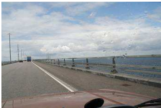
Auf der Öresundbrücke

Wir halten uns dann links und suchen uns in der Nähe von Faalborg einen Campingplatz. Der Himmel zeigt sich mal freundlich mit Sonnenschein, mal trüb und regnerisch. Die großen breiten sandigen Strände Dänemarks sind hier eher klein, eng und mit Gras bewachsen. Das stört uns aber wenig, das windige Wetter lädt eh nicht zum Baden ein. Nachmittags fahren wir in die hübsche kleine Stadt mit der typischen nordischen Architektur, bummeln durch die Straßen genießen