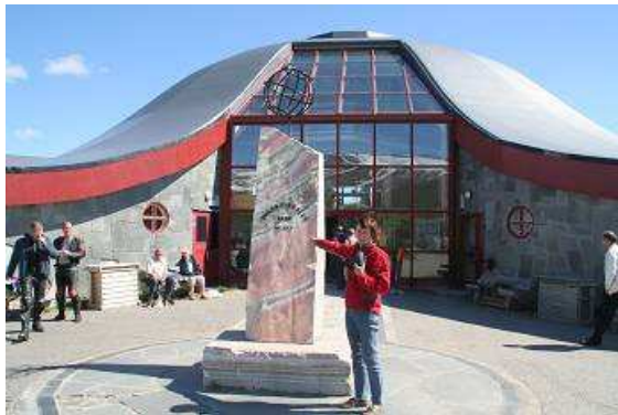
Polarkreiszentrum bei Mo i Rana

alles, der Wartburg springt an und tuckert wie gewohnt auf allen drei Zylindern. Das ändert sich bis nach Hause auch nicht mehr. Den genannten Preis von 100 NOK finde ich ganz schön heftig, frage, ob er auch mit einer Halbliterflasche „Jack Daniels“ zufrieden wäre. Der Deal ist perfekt, beide Seiten sind glücklich, so fahren wir weiter die E6 entlang bis Mo i Rana. Hier am Polarkreiszentrum überqueren wir wieder den Polarkreis, diesmal in Richtung Süden, so ist abends wieder mit zunehmender Dunkelheit zu rechnen. Heute ist jedoch bestes Wetter, strahlender Sonnenschein, kaum Wind und warm. (Wenn man lange genug in kühleren Gefilden gewesen ist, sind auch 18 Grad schon warm!)