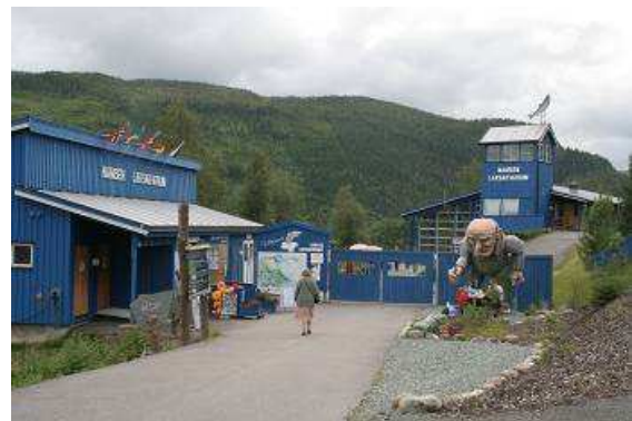
Eingang zum „Namsen Laksakvarium“

Unser Tagesziel ist eigentlich Trondheim, einen Zwischenstopp legen wir am Fluss Namsen ein. Hier gibt es eine sehr schön gestaltete Ausstellung über die Nutzung der Wasserkraft in Norwegen, über den Fischfang, speziell das Angeln von Lachsen, die Herstellung und Entwicklung von Angelruten, Blinkern und Haken, ein Lachsaquarium und natürlich eine Lachstreppe mit Fenstern zur Beobachtung der leckern Tiere.