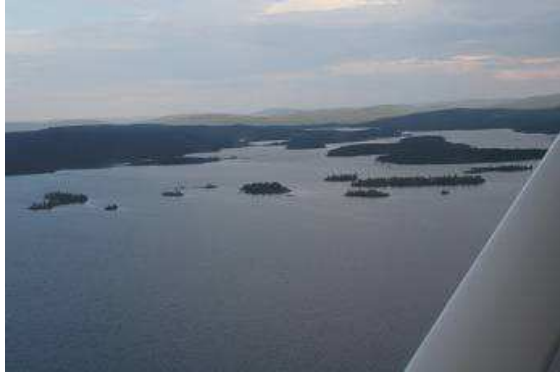
Blick aus der Cessna über den Inarisee

gleiten wir über das Wasser und heben ab. Unter uns der See mit seinen tausenden herrlichen kleinen Inseln, wir genießen den fantastischen Blick über den See und die Insel mit der heiligen Kirche der Samen.