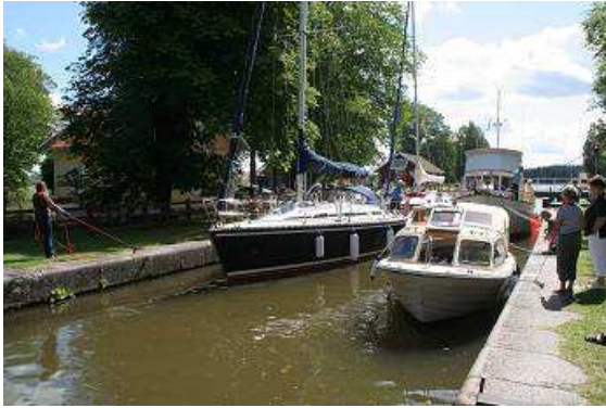
Frauen mit ihren Booten an der Leine

Einkehrmöglichkeiten, auch ein Modell des Kanals auf einem Grundstück eines ehemaligen Maschinenhauses.