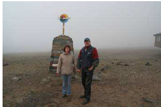
Morgens am Nordkapp

Eine weitere Ausstellung ist dem Kampf des deutschen Schlachtschiffes „Scharnhorst“ gegen die englische Marine gewidmet und seinem tragischen Ende mit Tausenden gefallenen Soldaten. Die mahnende Botschaft lautet, dass das nördliche Eismeer ein Platz des Friedens