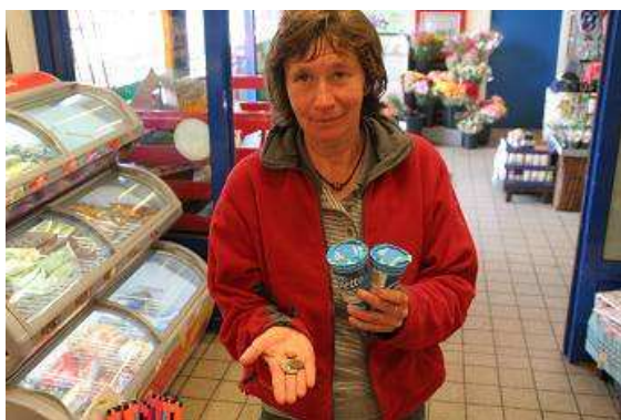
Die letzten dänischen Kronen setzen wir in zwei Eis um

Dort angelangt, reihen wir uns in eine lange Warteschlange ein, lösen ein Ticket, dann erklärt uns der Kassierer, dass wir sicherlich mit dem nächsten Schiff nicht mitkommen werden und noch einmal eineinhalb Stunden warten müssten. Doch wir haben Glück, als letzter Wagen, ganz am Ende des Decks, nur eine handbreit von der Sicherheitsabsperrung entfernt, werden wir eingewiesen, vorbei an etlichen wesentlich größeren Fahrzeugen, die dann eben noch eineinhalb Stunden warten müssen. Die Überfahrt geht zügig, in Sonderbourg ist unsere letzte Station in Dänemark. Wir geben unsere letzten dänischen Kronen für zwei Eistüten aus und lassen uns die in der Sonne schmecken. Über Flensburg fahren wir nach Husum in die „graue Stadt am grauen Meer“, statten Theodor Storm einen Besuch ab und bummeln ein bisschen am Hafen zwischen den Buden des