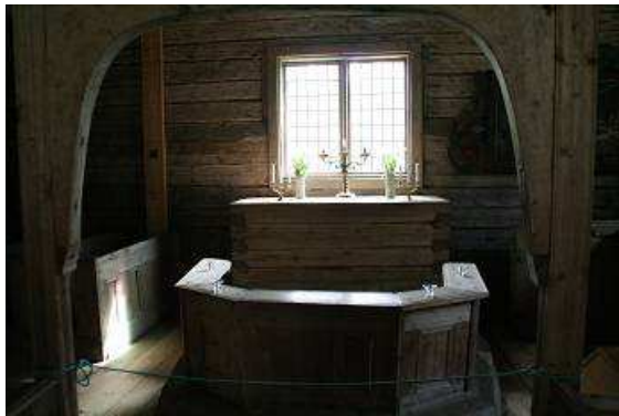
Altar der ältesten Holzkirche Lapplands in Sodankyla

weitere Leckereien. Dann wird das Dachzelt eingeklappt, alles verpackt und es geht auf zu einem Baumarkt um Material für die Reparatur des Kühlwasserschlauchs zu kaufen, Gaze als Ersatz für das nicht auffindbare Mückennetz und Räucherstäbchen nach einem ganz neuen Rezept. Die halten die Mücken auf jeden Fall fern, versicherte uns die Wirtin unserer letzten Unterkunft. Nächstes Ziel ist Sodankyla, dort besichtigen wir die älteste Holzkirche Lapplands. Der Eintritt ist kostenlos, Erklärungen müssen bezahlt werden. Die Kirche macht in ihrem Inneren wirklich einen sehr düsteren,