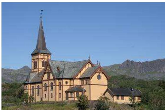
Lofotenkathedrale nahe Svolvær

Den Campingplatz verlassen wir bei herrlichem Sonnenschein und beschließen, irgendwo unterwegs an einem schönen Plätzchen am Strand eine Pause einzulegen und ausgiebig zu frühstücken. Vorher stoppen wir noch an der Lofoten-Kathedrale von 1898. Das ist eine sehr große Kirche am Stadtrand von Svolvær mit 1200 Sitzplätzen. Dort versammelten sich die Fischer, Seefahrer und andere Inselbewohner zum Gottesdienst. Im April zur Hauptfischfangzeit haben oftmals die Sitzplätze nicht ausgereicht, so standen noch etliche Menschen zur Andacht in den