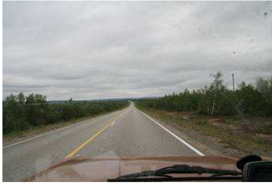
Einsame Weiten Lapplands

schießen. Nahe der Stadt Kanigasniemi gehen wir in eine hübsche kleine Gaststätte mit Terrasse, lassen uns bei bestem Wetter eine finnische Pizza schmecken und lauschen den Geschichten der Angler.