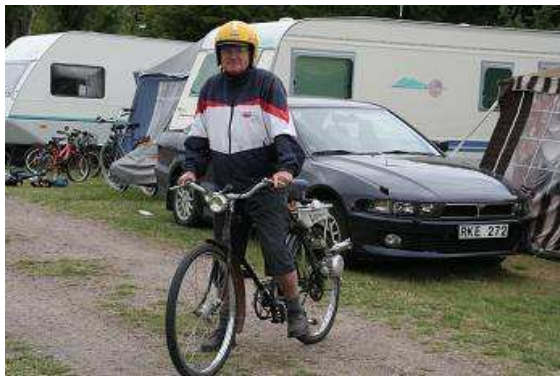
Hackenwärmer auf Schwedisch

einem gelben Sturzhelm auf dem Kopf, damit Brötchen holen fahren. Tachostand: 8519km