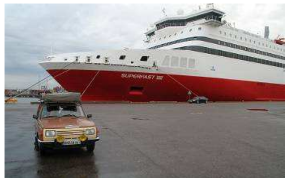
Im Hafen von Helsinki, der „Wartburg“ vor der „Superfast“

8:20 Uhr schrillt der Wecker, von neun bis elf Uhr ist Frühstücksbuffet zum Schnäppchenpreis von zwölf Euro, pro Person versteht sich. Dafür ist es sehr reichlich mit warmen und kalten Speisen, mit Lachs, Fleisch, Wurst, Ei, Käse, süßen und deftigen Speisen. Tierisch verboten ist das mitnehmen von Speisen nach außerhalb, ich kümmere mich nicht darum, mache uns zwei Brötchen und lassen diese in der Innentasche meiner Jeansjacke verschwinden. Dann an Deck ein Rundgang, ist ja riesig, das Schiff, zum Glück aber nicht jeder Platz ausgebucht. So können wir eigentlich überall zum Verweilen ein Plätzchen finden. Im Moment ist es ziemlich windig, kühl und grau, sodass so ein Aufenthalt an Deck nicht sehr angenehm ist. Wir gehen in unsere Kabine, holen den verlorenen Schlaf nach, ist ja kein Problem, es ist dunkel ohne Fenster. Nachmittags stöbern wir dann in unserer Literatur, machen die Feinplanung unserer Reise durch Finnland und genießen die Sonne an Deck, die jetzt am blauen Himmel scheint und eine angenehme Wärme verbreitet.