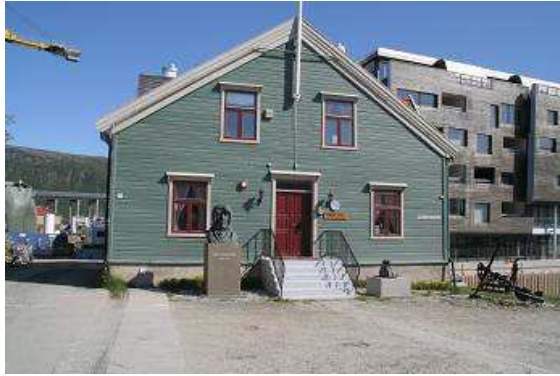
Polarmuseum mit Amundsens Büste in Tromsø

Südpol und seinen tragischen Ausgang sowie über die Jagd von Robben, Eisbären und anderen Tieren in arktischen Gebieten. Heute wird sehr viel über Sinn und Unsinn dieser Tradition diskutiert, doch für die Norweger ist es eine uralte Jagdtradition, die sie sich trotz Artenschutzabkommen und internationalen Ächtungen nicht nehmen lassen. Nachmittags schauen wir bei einem Kaffee auf dem zentralen Platz dem bunten Treiben am Hafen zu. Anschließend geht es über die Brücke auf die andere Seite des Fjords zur Eismeer Kathedrale aus dem Jahr 1963.