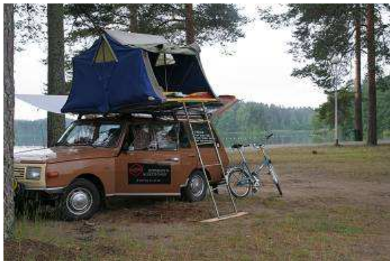
Fertig zum Übernachten