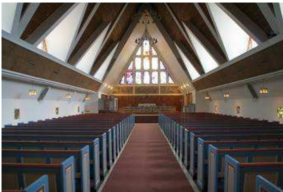
In der Kirche von Hammerfest

würde diese sicherlich nicht anders ausfallen. Anschließend besuchen wir die für ihre einzigartige Architektur bekannte Kirche, sie erinnert in ihrer Gestalt an die traditionellen Trockenfischgerüste, im Inneren ist sie sehr schlicht gehalten mit einem riesigen bunten Fenster im Giebel und von Licht durchflutet.