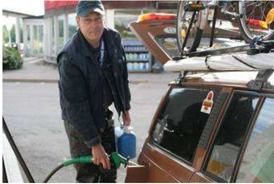
Tanken alle dreihundert Kilometer