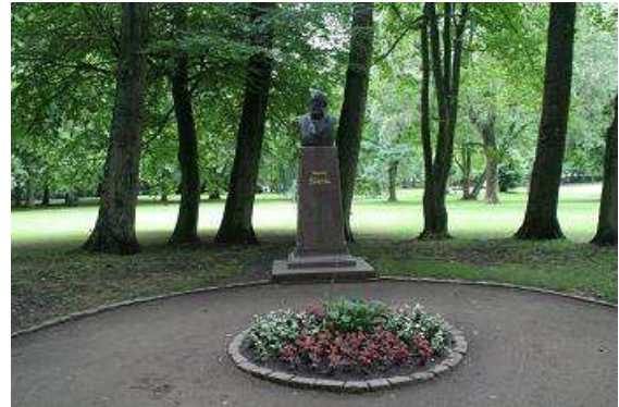
Theodor Storm Denkmal in Husum

Als wir den kostenpflichtigen Parkplatz verlassen wollen, befindet sich ein Hinweis am „Wartburg“, dass die Ausfahrt des