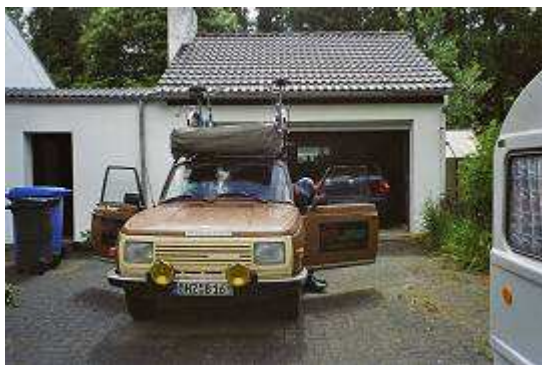
Fertig gepackt zur Abfahrt

Der Tachometer zeigt 2450km, wirklich sind es 102.450km.