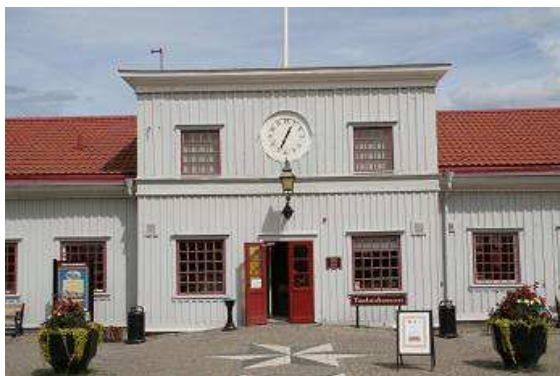
Strichholzmuseum in Jönköping

befindet sich in der ältesten Zündholzfabrik des Ortes. Hier wurden 1848 die Streichhölzer erfunden, als Patent angemeldet und Jahrzehnte lang in großen Mengen produziert und weltweit exportiert.