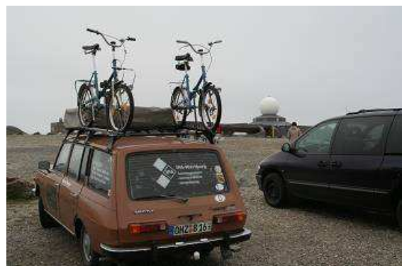
4°C und frischer Wind am Nordkapp

kommen und gehen wie man will. Auch hier gibt es wieder anerkennende Worte für den Wartburg und auch für die Canon Kamera. Noch zweihundert Meter, wir ergattern einen der begehrten Parkplätze in erster Reihe, nach fast 3000 km Fahrt sind wir „angekommen“, angekommen am nördlichsten Punkt Europas bei 71^{\circ}10'21'' .Luftlinie sind wir 2170 Kilometer von Berlin entfernt, näher ist es zum Nordpol, das sind nämlich „nur“ noch 2110 Kilometer. Es ist zwar immer noch stark bewölkt, stürmisch und regnerisch, aber eben kein Nebel.