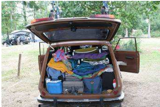
Das letzte Mal in diesem Urlaub packen wir ein

verpackt, wir fahren zu einer kleinen Fähre, die uns den Weg in Richtung Flensburg erheblich abkürzt.