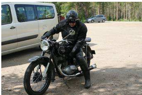
russisches Zweitaktmotorrad von Typ „Isch“

Halbjährlich wird das Outfit gewechselt, immer dann, wenn die Jahreszeit es erfordert. Schließlich soll das Volk weder Frieren noch Schwitzen. Gleich daneben ist eine sehr rustikale Freiluftgaststätte errichtet, hier gibt es Kaffee, Pfannkuchen (Omelett) und anderen Kuchen, alles auf dem Holzfeuer oder im Holzofen zubereitet. Wir laufen etwas zwischen den „Püppchen“ hin und her, amüsieren uns über so manches Kleidungsstück oder Accessoire aus längst vergangenen Zeiten. In der Ferne höre ich ein sehr vertrautes Geräusch, sehr zweitaktend, aber eher von einem Motorrad, aber auch nicht wie eine MZ oder JAWA. Es ist eine russische ISCH, die, liebevoll restauriert mit einem schon etwas betagtem Fahrer auf den Parkplatz einbiegt. Eine kurze Unterhaltung, ein Foto, dann die Motorhaube auf und das 50PS Aggregat des „Wartburg“ wird angeschaut.