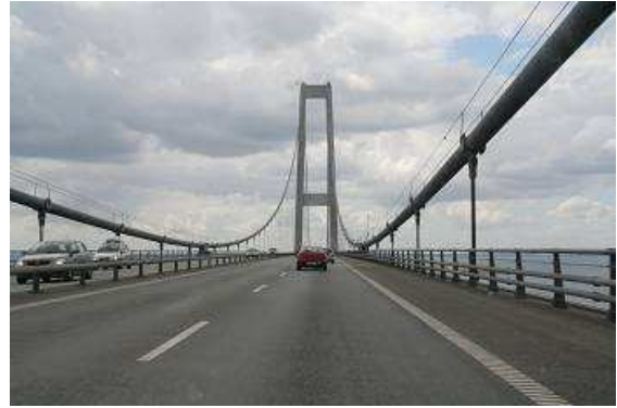
Brücke über den großen Belt