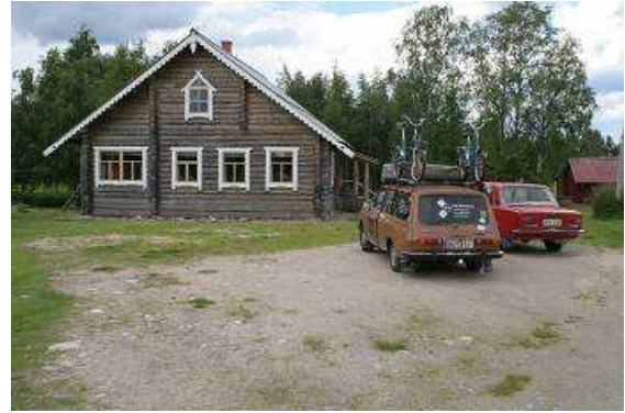
Hier ist Finnland zu Ende und der „Schutzstreifen“ entlang der russischen Grenze beginnt

In Finnland gibt es einen drei bis vier Kilometer breiten „Schutzstreifen“, entlang der Grenze, der nicht zu betreten und zu befahren ist. Straßen und Wege enden in einer eleganten Wendeschleife und ruck zuck fährt man wieder in die Richtung, aus der man gerade eben kam. Blickt man in Richtung Russland, sieht man erst noch ein Stück Wiese, dann folgt dichter, scheinbar undurchdringlicher Wald. Hinweisschilder sagen aus, dass man sich im grenznahen Gebiet befindet, hier eigentlich nichts zu suchen hat und sich bitte wieder in Richtung Landesinnere bewegen sollte. Wir kommen gern dieser Aufforderung nach, außer einem Foto „Wartburg mit LADA“ in herrlicher Natur und absoluter Ruhe, gibt es hier nichts.