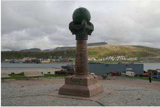
Bronzene Erdkugel in Hammerfest

würde diese sicherlich nicht anders ausfallen. Anschließend besuchen wir die für ihre einzigartige Architektur bekannte Kirche, sie erinnert in ihrer Gestalt an die traditionellen Trockenfischgerüste, im Inneren ist sie sehr schlicht gehalten mit einem riesigen bunten Fenster im Giebel und von Licht durchflutet.