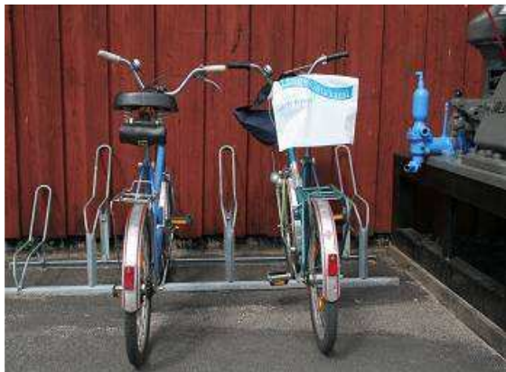
Unsere stillen Begleiter, zwei MIFA Minifahrer