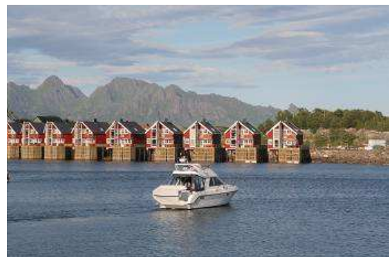
Svolvær auf den Lofoten

Nach einem schnellen Frühstück packen wir alles ein und fahren auf kleinen Straßen abseits der E6 über die Vesteralen nach Svolvær, die Inselhauptstadt der Lofoten. Im Norwegischen heißen die einfach „Lofotr“, eine Einzahl oder Mehrzahl dieses Wortes gibt es nicht. Gemeint ist immer die gesamte Welt der vielen kleinen und mittleren Inseln, die im unteren Teil grün, dann immer steiniger werdend, schroff aus dem Meer aufragen. Verziert werden sie mit hunderten niedlichen Fischer- und Seefahrerhäuschen, die einen bunten Saum an den Ufern bilden.