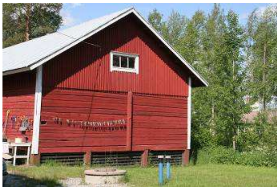
karelisches Haus mit Trockenfisch

Ein weiterer Abstecher führt uns über 20 Kilometer unbefestigte Straße zu zwei karelischen Dörfern, die direkt an der russischen Grenze liegen. Was heißt direkt.