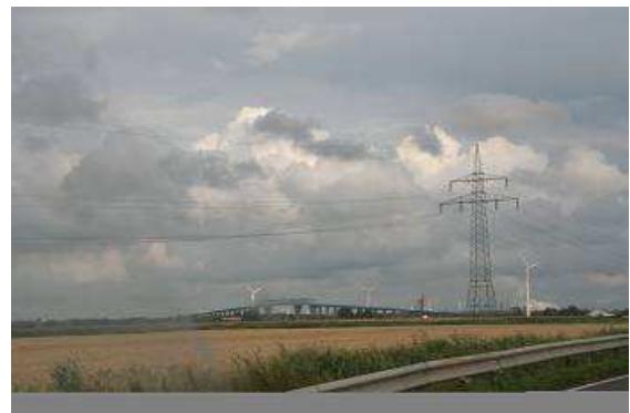
Hochbrücke über den Nord-Ostseekanal bei Brunsbüttel

Parkplatzes eine „beschränkte Höhe“ hat und wir uns beim Pförtner melden sollten. Diese überschreiten wir mit unseren Rädern auf dem Dach, um Ärger und Kosten aus dem Wege zu gehen, packen wir die Räder kurzerhand ab, schieben diese vom Parkplatz und verlassen die Einrichtung auf ganz legalem Wege. Anschließend werden die Fahrräder wieder verstaut, wir nehmen den Anweisungen von Frau GARMIN folgend, kleine Straßen bei schönem Wetter durch Schleswig- Holstein zur Fähre Glückstadt- Wischhafen über die Elbe. Die A7 und der Elbtunnel sind wieder einmal hoffnungslos zugestaut, so haben noch mehr Leute die Idee, diese Fähre zu benutzen. Es geht aber zügig voran und die letzten neunzig Kilometer bis nach Hause sind auf ebenfalls kleinen Straßen zügig zurückgelegt.