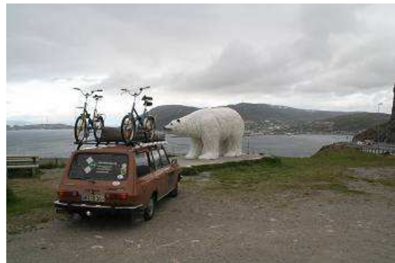
Am Ortseingang von Hammerfest

und der Völkerverständigung ist und nie wieder zu einem Kriegsschauplatz werden soll. Nachdem wir weitere diverse Dioramen, Bilder und Ausstellungsgegenstände angeschaut haben, verabschieden wir uns vom Nordkapp und begeben uns, wieder der E6 folgend, in Richtung Hammerfest. Dort angekommen erleben wir einen weiteren Superlativ, Hammerfest ist die nördlichste Stadt Europas, liegt bei 70°39'48'' und hat einen ganzjährig eisfreien Hafen, der Heizung aus dem Golfstrom sei dank. Am Ortseingang gleich neben der Shell Tankstelle hoch über dem eigentlichen Ort begrüßt uns ein überdimensionaler Eisbär.