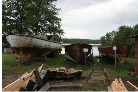
Restaurierungsobjekte für zukünftige Tätigkeiten

In einem kleinen Café, das ebenfalls zur Ausstellung gehört, gibt es leckeren Kuchen, hergestellt aus Mehl, das nach alter Tradition in der ebenfalls zur