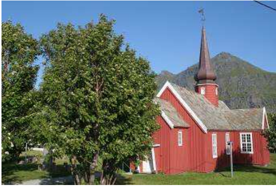
Kirche von Flaksted

Fähre nach Bodö. Das ist eine größere Stadt und ich denke, wir bekommen dort auch eine Zündspule. Die Schlange an der Fähre ist lang, wir stellen uns an, der Kassierer macht uns aber keine Hoffnung, noch mit diesem Schiff mitzukommen. Das Nächste fährt dann in zwei Stunden. Wieder einmal haben wir Glück und können noch auf die Fähre fahren. Direkt hinter uns schließt sich die riesige Klappe und die vierstündige, ziemlich langweilige Überfahrt beginnt. In der Ferne sehen wir noch etliche kleine und kleinste Inseln, vielleicht sind auch die Vogelschutzinseln Väroy und Röst dabei. Im Gegensatz zu unseren Vogelschutzinseln in Nord- und Ostsee sind diese beiden aber bewohnt, manche Fähren fahren dorthin und auch als Tourist kann man diese Inseln mit seinem eigenen Fahrzeug besuchen.