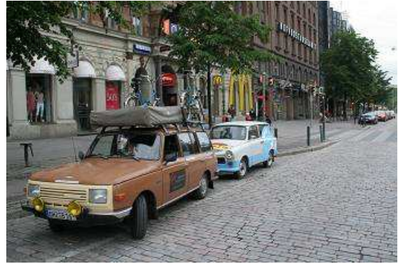
Deutscher Wartburg und finnischer Trabant vor einem amerikanischen Spezialitätenrestaurant in Helsinki

Jetzt steigen wir in unseren Wartburg, fahren noch einmal in Richtung des Trabant, und, Glück gehabt, er steht noch da, also schnell eingeparkt und ein paar Fotos mit den beiden Zweitaktern geschossen.