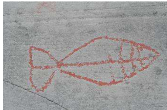
Tausende Jahre alte Felszeichnungen bei Alta

dass früher eben alles besser war, oder sind es Mitglieder des „königlichen Eisbärenclubs“, den es hier in Hammerfest gibt? Für eine gewisse Summe kann man im örtlichen Rathaus Mitglied werden und eine Urkunde über die Mitgliedschaft erwerben, wir belassen unsere Mitgliedschaft aber bei den „IFA-Freunden Sachsen“. Weiter geht die Fahrt wieder die kleine recht kurvige und bergige Straße zurück zur E6, der Lebensader Nordnorwegens. Die verfolgen wir erst einmal bis Alta um uns die Jahrtausende alten Felszeichnungen im örtlichen heimatkundlichen Museum anzuschauen. Wir spazieren durch das große weitläufige Gelände am Ufer des Altafjords entlang und betrachten Bären, Fischer, Rentiere Boote und Familienszenen auf den 2000 bis 6200 Jahre alten Zeichnungen.