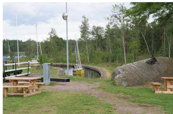
Eine komplizierte Passage des Kanals

Besichtigung stehenden Wassermühle gemahlen wird. Eine Zeit lang schauen wir noch dem Treiben an einer weiteren Schleuse des Götakanals zu, die liegt direkt an der Straße und in einem ziemlich engen Bogen des Kanals. Die Skipper haben alle Hände voll zu tun, ihre Boote aneinander vorbeizumanövrieren und nicht an den Wänden anzuschlagen.