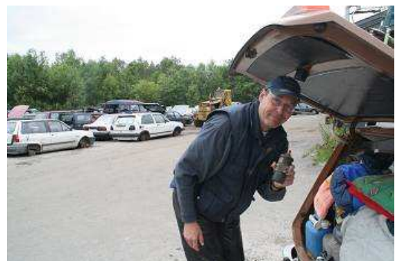
Auch eine alte Zündspule kann glücklich machen

Nach einem Kaffee und einem kleinen Imbiss gehe ich sehr optimistisch zu der Werkstatt und frage den Chef nach einer Zündspule. Wahrscheinlich kommt ihm unser Wartburg etwas suspekt vor, Zweitakttechnik, nie daran geschraubt, weiß ich nicht, habe ich nicht, kann ich nicht, doch er nennt uns einen Autofriedhof nicht weit entfernt und in unserer Richtung. Dort, meint er, werden wir bestimmt fündig.