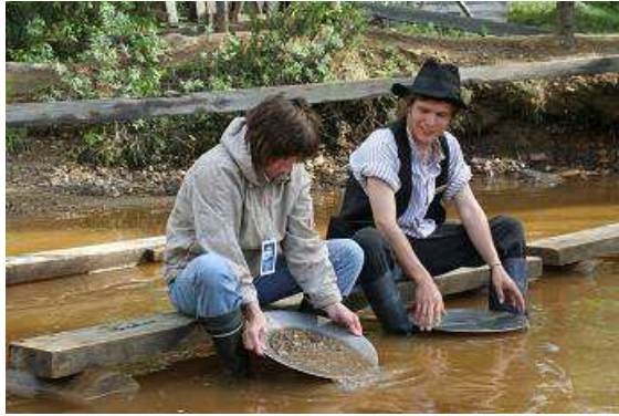
Gold waschen unter fachkundiger Anleitung

chromblitzenden Autos und Monaco, mit sich, ihrer Schüssel und den eventuell zu findenden Nuggets beschäftigt. Sie alle kommen dann mit total zerstochem Gesicht und Händen meist ohne Gold von „ihrem“ Waschplatz zurück.