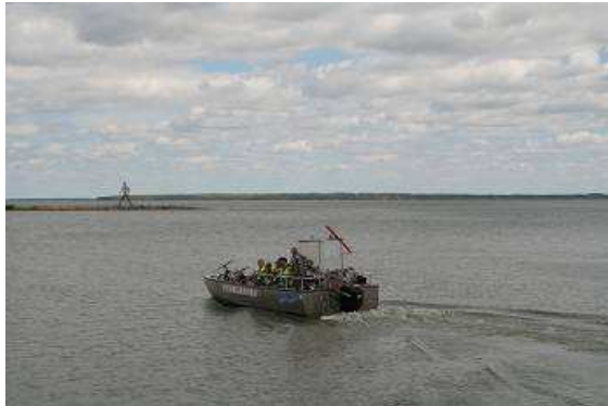
Fahrradfähre über den Roxensee, im Hintergrund Kunst am Kanal (der Mann heißt „Dubbeltgänger“ und ist von Kent Karlsson aus 2006)

Kunstwerke in einer Ausstellung „Kunst längs des Götakanals“ zu sehen. Das ist eine Ausstellung von plastischen Kunstwerken, die mehr oder weniger versteckt entlang des Kanals platziert sind und von schwedischen Künstlern stammen.