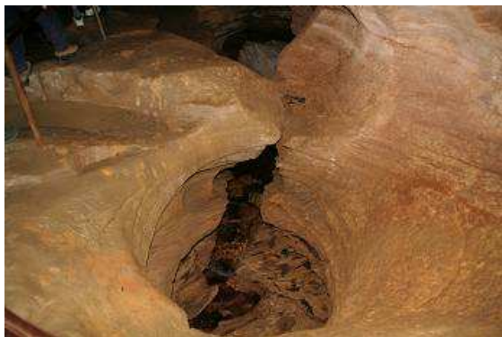
Gletschermühle im Inneren der Grotte

In sehr gutem Englisch erklärt er uns die eigentlich unerklärliche Entstehung der Höhle und die noch unerklärlichere Anwesenheit eines riesigen Granitblocks im Innern, eng umschlossen von dem sonst vorherrschendem Kalkstein. Die Grotte, 1200 Meter lang, und am Ende ist der eben beschriebener Granitkoloss zu sehen. Die Wege sind wirklich sehr rutschig und unser Guide hat alle Hände voll zu tun, seine ihm anvertrauten Gäste heil wieder hinauszubringen.