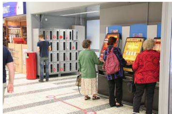
Glückspiel erst ab 18!

schon ihre Zelte und Stände abgebaut, nur zu essen gibt es immer noch. Bei herrlichem Sonnenschein, 24° und wolkenlosem Himmel lassen wir uns karelishche Piroggen, Kaffee und Eis schmecken. Anschließend gehen wir in einen Supermarkt, um etwas gegen diese kleinen Plagegeister „Mücken“ zu holen. Offensichtlich ist das Mückennetz am Eingang des Zeltes dann doch zu Hause liegen geblieben, es ist weder im Auto noch im Zelt zu finden. Wir finden nichts dergleichen, beobachten aber etwas für Deutschland völlig ungewöhnliches. Während bei uns Spielautomaten eher unbeachtet in einer Ecke stehen oder bestenfalls von Jugendlichen oder Truckern in dunklen Kneipenecken bedient werden, sind die drei hier vorhandenen Zockerautomaten von Damen im reifen Alter belegt, besser gesagt, von drei Rentnerinnen. Sobald eine das Spiel aufgibt, ist schon wieder eine andere Dame am Zug, besser gesagt am Automaten.