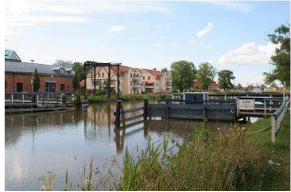
Schwedens kürzeste Fährverbindung

Morgens sitzen wir beim Frühstück, da fährt schon das erste große Passagierschiff