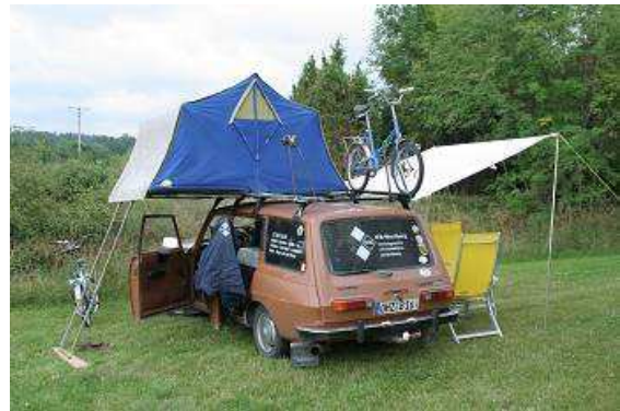
Camping im Obstgarten

und gleich neben uns nimmt ein Opel Astra Aufstellung zur Nacht mit Kennzeichen „UM“! Die beiden sind etwas verstört auf meine Frage, wo sie herkommen. Nein sie können es nicht wissen, dass unser „Wartburg“ bis vor kurzem auch ein „UM“- Kennzeichen hatte. Tachostand: 8142km.