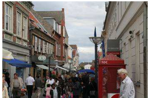
In der dänischen Kleinstadt Faalborg