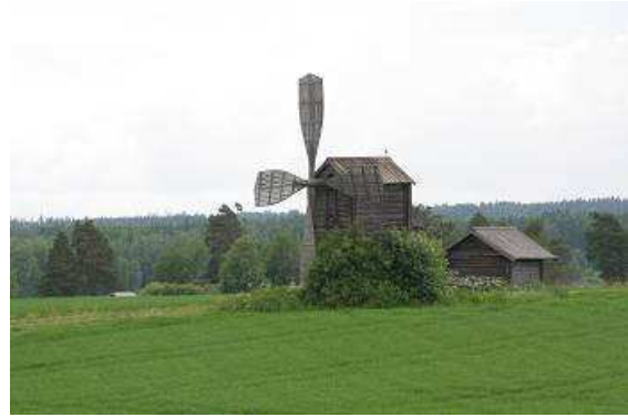
Windmühle in Karelien

Der Tag beginnt mit einem Frühstück am See bei Sonnenschein, dann starten wir, nachdem alles verpackt ist, in Richtung Joensuu. Ein Porschefahrer winkt uns zu, er fährt einen orangenen 911er aus den frühen siebziger Jahren. Wir haben unseren Kurs in Richtung Norden durch den einsameren Teil Finnlands im Osten nahe der Grenze zu Russland gewählt. Den ursprünglichen Plan, ein Stück durch „Russisch-Karelien“ zu fahren, mussten wir dann doch verwerfen, die Einreisebestimmungen sind nicht sehr touristenfreundlich. Die Straßen werden immer einsamer, wir fahren oft kilometerweit, ohne einem Fahrzeug oder einem Menschen zu begegnen. An der Straße sehen wir eine hübsche alte Windmühle ganz und gar aus Holz gebaut, die ist in einem ganz anderen Stil als bei uns üblich, erstellt. Sie sieht viel gedrungener aus und offensichtlich funktioniert das Flügelwerk etwas anders als bei den hiesigen Mühlen. Gegen 16 Uhr erreichen wir Joensuu. Über diverse Umleitungen und Baustellen finden wir den Tori (Marktplatz). Hier soll täglich ein großer karelisher Markt stattfinden, doch um diese Zeit haben die meisten Händler