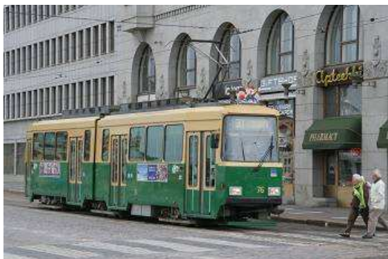
Stadtrundfahrt in Helsinki mit der Straßenbahn