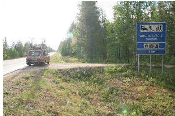
Am Polarkreis in Karelien Richtung Norden

Ein kleines Stück weiter fahren wir auf einen hübschen kleinen Campingplatz, der auch Hütten anbietet, alle sehr schön typisch karelich hergerichtet. Neben den Gastgebern erwarten uns auch mindestens eine Million Mücken, die sich schon längst an den Duft diverser kosmetischer Mittelchen und Autan gewöhnt haben.