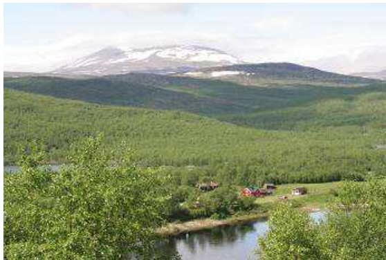
Am Fluss Tana

schießen. Nahe der Stadt Kanigasniemi gehen wir in eine hübsche kleine Gaststätte mit Terrasse, lassen uns bei bestem Wetter eine finnische Pizza schmecken und lauschen den Geschichten der Angler.