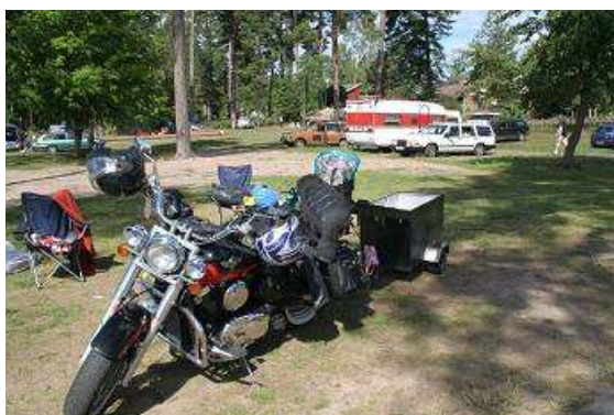
Eines der Familienmotorräder mit Anhänger