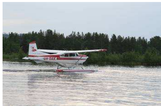
Wasserflugzeug „Cessna 185“ startet auf dem Inarisee

am Himmel, so langsam müssen wir auf die Uhr schauen, wir verlieren bei dem herrlichen Wetter mit Sonnenschein während der ganzen Nacht völlig das Gefühl für die Zeit. In Kürze erreichen wir Inari, ein kleines beschauliches Städtchen, dass aber jeder Kreuzworträtselfreund kennt. Bei herrlichem Sonnenschein und 24 Grad fällt uns die Entscheidung nicht schwer, eine Runde mit dem Wasserflugzeug Cessna 185 über den See zu drehen.