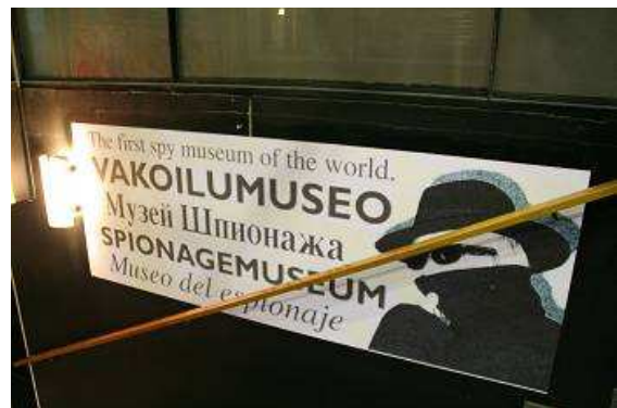
Das erste Spionagemuseum der Welt ebenfalls in Tampere

Ein weiteres sehr interessantes Museum in dieser Stadt ist das Spionagemuseum, was wir uns noch ansehen. Untergebracht ist es in einem alten, sehr schön restaurierten Fabrikgebäude direkt an der Straße neben dem Fluss, zusammen mit einem Einkaufszentrum, kleinen Restaurants und Spielotheken. Auf die komme ich später noch einmal zurück. Man braucht etwas „Spionagesinn“ um diese Einrichtung in der unteren Etage des Gebäudes zu finden. Diverse Spionagegeräte kann man selbst testen, zu sehen sind aber auch verschiedene Varianten, um Gegner möglichst unbemerkt aus dem Wege zu schaffen. Den großen Spionen dieser Welt ist jeweils ein Abschnitt der Ausstellung gewidmet, unter anderem auch Markus Wolf und anderen Persönlichkeiten dieses dunklen Geschäftes, die oft genug für Freund und Feind gearbeitet haben.