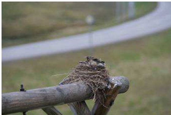
Der zugigste Ort, ein Nest zu errichten

Es wird ein typisches Nordkappfrühstück mit reichlich heißem Kaffee, Lachs, Rentierwurst, „Smörebröd“, Ei, Marmelade, Honig, Salate und, und, und. Dabei beobachten wir aus dem Fenster ein Vogelpärchen, die von ihren Eltern wahrscheinlich nicht viel beigebracht bekamen. Auf der zugigsten Stelle weit und breit, einer mitten auf freier Fläche stehenden Wäschestange haben die beiden ein Nest gebaut, junge Vöglein ausgebrütet und versuchen nun gegen den Wind ankämpfend, die Brut mit Würmern und anderen Delikatessen zu versorgen. Oft genug werden sie von einer Bö erfasst und abgetrieben, die Beute geht verloren, der Nachwuchs schreit, das Nest droht zu kippen, aber unbeirrt setzen die „Alten“ ihr Werk fort.