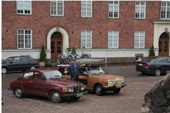
Wartburg und Saab vor der unterirdischen Felsenkirche in Helsinki

Bei trübem Wetter teilweise mit heftigem Regen geht es weiter in Richtung Tampere, dort gibt es ein kleines aber feines Leninmuseum. Ich kann meine Geschichtskennntnisse auffrischen, ebenso meine Kenntnisse der russischen Sprache. Was hat Lenin mit Finnland zu tun, wird