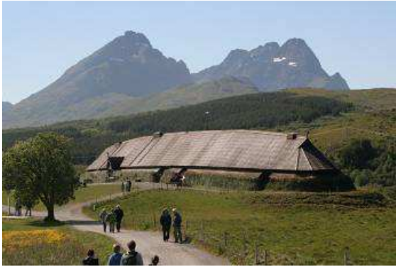
Rekonstruiertes Wikingerhaus auf den Lofoten bei Borg

Oslo im Museum. Obwohl wir herrlichen Sonnenschein haben, ist es ziemlich kühl, es weht hier oben auf der freien Fläche ein ziemlich eisiger Wind vom Meer herüber. Im Museumscafé gibt es einen schönen heißen Kaffee, dazu ein Stück Apfelkuchen, nach alter Tradition gebacken. Schmeckt köstlich. Wir fahren weiter, unser nächstes Ziel ist Nusfjord auf der Insel Flakstadoy, die man durch einen, ausnahmsweise kostenfreien Tunnel erreicht. Wir fahren über schmale, malerische Straßen, mal mit zwei, mal mit drei Zylindern, in den Ort selbst darf man nicht mit dem Auto hinein. Davor ist auf einer Anhöhe mit kurzem aber steilen Anstieg ein Parkplatz eingerichtet. Ich nehme ordentlich Schwung um zügig mit reduzierter Motorleistung hinaufzukommen, als plötzlich mitten am Berg das Fahrzeug vor uns stoppt. Den Blick gen Himmel gerichtet, versuche ich mit Vollgas und schleifender Kupplung wieder loszukommen, es klappt mit Mühe und Not. Oben angekommen, beschließe ich jetzt eine neue Zündspule einzubauen, um dem Treiben ein Ende zu bereiten, doch an dem Platz, wo diese immer lagen, nämlich unter der umgeklappten Rücksitzbank, liegen keine Zündspulen. Wir räumen das ganze Auto aus, ich krieche in jede Ecke, unter jeden Sitz, schaue in diversen Kästchen nach, finde alles, aber der Dreierpack Zündspulen, den ich für alle Fälle bereitgelegt hatte, ist wie vom Erdboden verschwunden. Wir packen alles wieder ein, noch einmal eine neue