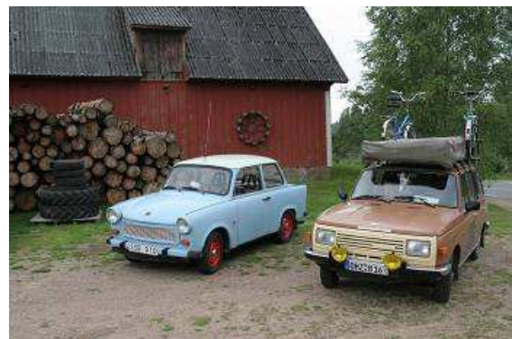
Wartburg mit Trabant auf einem schwedischen Bauernhof

den „Wartburg“ daneben und mache ein paar Fotos. „Ja“, sagt der Eigentümer, „der „Trabi“ ist gut und zuverlässig, wir fahren jeden Tag damit.“