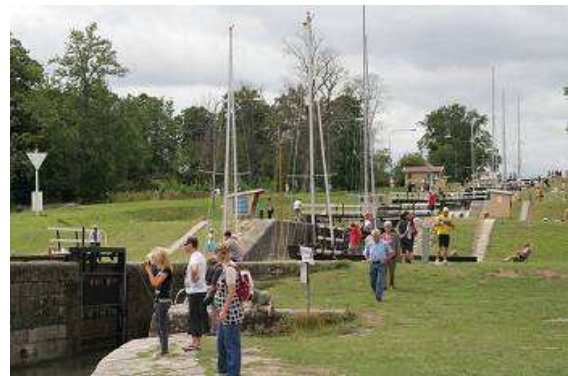
Schleusentreppe bei Berg

Nach dem Frühstück und dem Einpacken umrunden wir den Vätternsee nördlich in Richtung Berg. Das ist ein kleines Städtchen an der Mündung des Kanals in den Roxensee. Hier müssen die Schiffe durch eine Schleusentreppe von sieben hintereinander liegenden Schleusen einen Höhenunterschied von mehr als 18 Metern überwinden!