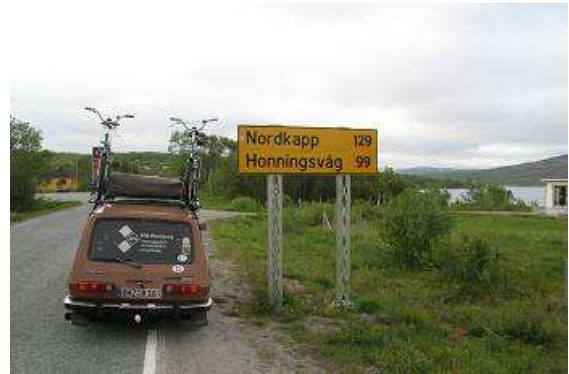
Das Ziel ist zum Greifen nahe

Geld und Informationen haben wir, jetzt gibt es kein halten mehr, auf das Gaspedal gedrückt und immer die E6 entlang über Lakselv bis zur Nordkappinsel. Frau GARMIN zeigt uns zwar immer noch den Weg, ist aber eigentlich völlig überflüssig.