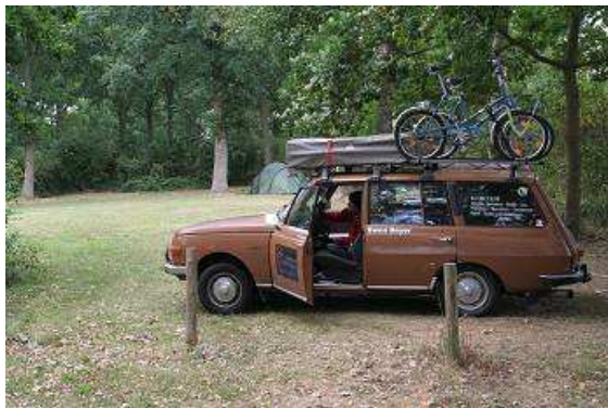
Bereit zur Abfahrt