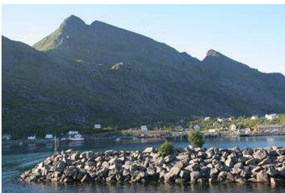
Abschied von den Lofoten

Fähre nach Bodö. Das ist eine größere Stadt und ich denke, wir bekommen dort auch eine Zündspule. Die Schlange an der Fähre ist lang, wir stellen uns an, der Kassierer macht uns aber keine Hoffnung, noch mit diesem Schiff mitzukommen. Das Nächste fährt dann in zwei Stunden. Wieder einmal haben wir Glück und können noch auf die Fähre fahren. Direkt hinter uns schließt sich die riesige Klappe und die vierstündige, ziemlich langweilige Überfahrt beginnt. In der Ferne sehen wir noch etliche kleine und kleinste Inseln, vielleicht sind auch die Vogelschutzinseln Väroy und Röst dabei. Im Gegensatz zu unseren Vogelschutzinseln in Nord- und Ostsee sind diese beiden aber bewohnt, manche Fähren fahren dorthin und auch als Tourist kann man diese Inseln mit seinem eigenen Fahrzeug besuchen.