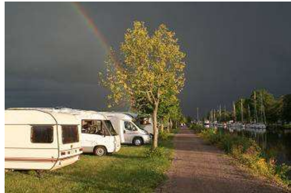
Abendstimmung am Götakanal mit Regenbogen