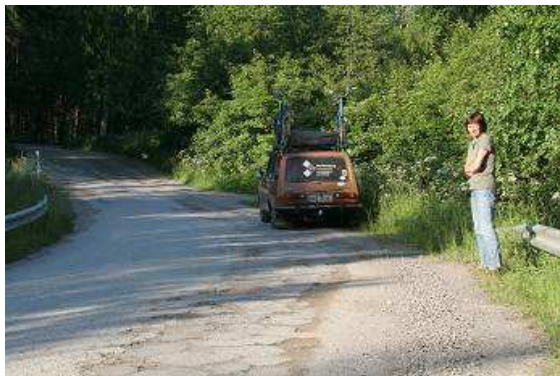
Mitten in der Einsamkeit Kareliens

Kirchen. Leider sehen wir nicht so viel davon, obwohl wir kleinste, teilweise unbefestigte Straßen fahren. Vielleicht erwarten wir auch zu viel von diesen schwärmerischen Naturbeschreibungen. Eine wunderschöne, offenbar verlassene Wassermühle sehen wir aber doch mitten in der Einsamkeit und die vereinzelt Höfe mögen hier auch schon als „Dorf“ zählen. Aus dem Nichts taucht ein Paar mit Paddelboot auf, die sich die Wasserläufe entlang durch die Mückenschwärme kämpfen. Wir setzen unsere Fahrt fort,