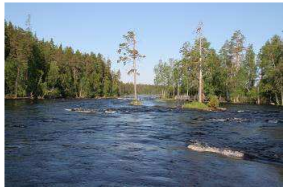
Wir beobachten Angler die ihr Glück vom Land, von einem der zahlreichen Stege oder direkt vom Wasser aus suchen.

Am Morgen genießen wir den Fluss, die Sonne, das herrlich warme Wetter, die Blicke auf die Stromschnellen. Wir packen unsere Burg zusammen und flüchten aus dieser eigentlich schönen Gegend, die Mücken verfolgen uns auf Schritt und,