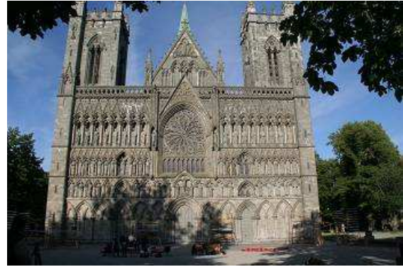
Die prächtige Fassade des Domes zu Trondheim

Morgens das gleiche Prozedere wie immer, erst Frühstück, hier mit frischen Brötchen aus dem Minikiosk, dann alles zusammenpacken und los geht's in die Stadt. Dabei handelt es sich um eine alte Bergarbeitersiedlung nahe der schwedischen Grenze, vorwiegend