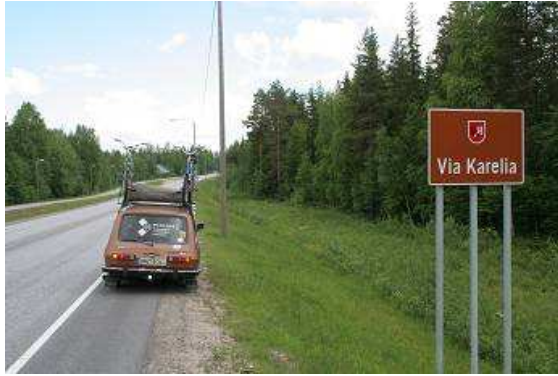
Touristenstraße mit wenig Verkehr; Via Karelia

das etwas unromantischer kommentiert: „Fische baumeln an einer Leine vor einem roten Haus!“