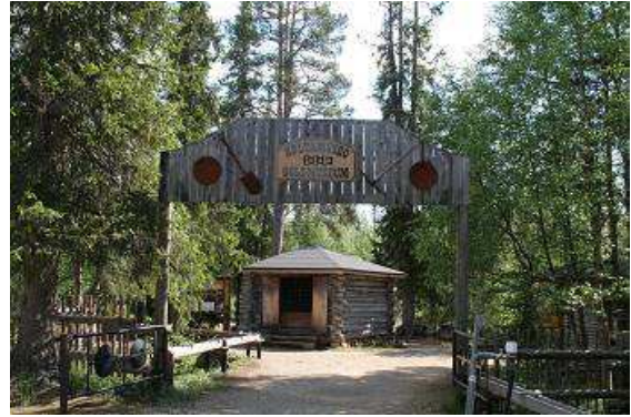
Goldmuseum in Tankavaara

alten Eindruck, alles aus schwerem, stark nachgedunkeltem Holz gefertigt. Die daneben stehende jüngere Kirche ist ebenfalls sehr sehenswert, wir begnügen uns mit einem Blick durch die Tür in das Kirchenschiff, ansonsten würde Eintrittsgeld fällig werden. Also rein in den Wartburg und weiter, das nächste Ziel heißt Tankavaara, eine der Goldgräberstädte im Norden Finnlands, die es bis heute überlebt hat und viele Touristen anzieht. Alle wollen ihr Glück beim Waschen von Gold probieren und zu ungeahntem Reichtum kommen, auch Marlo. Doch zuerst gehen wir durch die kleine Westernstadt, dann in das Goldmuseum. Dort erhält der Besucher einen Überblick über die Geschichte des Goldes, der Goldwäscherei und der verschiedenen Goldrausche, die Funde von Klumpen bis zu einem Kilogramm in der ganzen Welt ausgelöst haben.