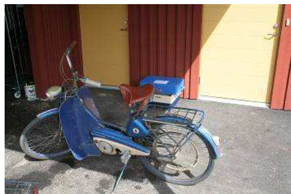
Moped Husqvarna mit Riemenantrieb

Nach dem obligatorischem Frühstück und Einpacken fahren wir nach Huskvarna und besichtigen das Fabrikmuseum des gleichnamigen Industriebetriebes. Hier wurden zahlreiche Erfindungen gemacht und in die Tat umgesetzt, zum Beispiel wurde die heute überall eingesetzte Mikrowelle hier erstmalig hergestellt. Der Betrieb verdiente und verdient viel Geld mit Motorrädern, Rasenmähern, Forstgeräten, Fahrrädern, Landmaschinen, aber auch Küchengeräte,