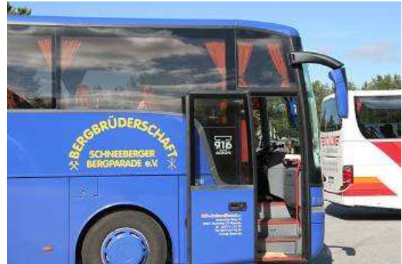
Am finnisch- norwegischen Grenzübergang

komme, traue ich meinen Augen nicht, ein lila Bus mit riesiger gelber Aufschrift „Bergparade Schneeberg“, ein Busreiseunternehmen aus Aue (meinem Geburtsort), das ebenfalls auf dem Weg zum Nordkapp ist.