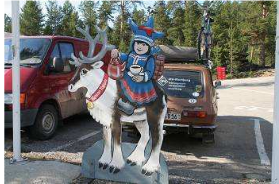
Einladung zum Imbiss an der Bärenhöhle

Am Fuß der Höhle gibt es einen sehr schönen Parkplatz, natürlich Gastronomie und Souvenirshop mit allen erdenklichen möglichen und unmöglichen Andenken. Auch ein Foto mit dem Bär kann man haben, wenn man dafür zahlt. Wir lassen uns einen Kaffee schmecken und ein Brötchen mit Rentierwurst. Ist sehr mager, sehr delikats. Die Sonne steht noch hoch