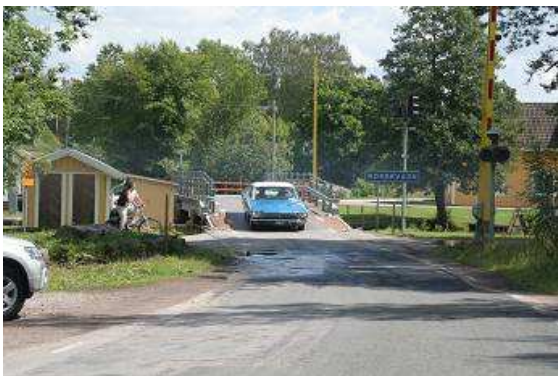
Gepflegter amerikanischer Straßenkreuzer am beschaulichen Götakanal

Wir liegen morgens noch eine ganze Zeit im Zelt und hören dem Regen zu, wie er auf unser Stoffdach trommelt. Jedes Mal, wenn es weniger wird, wollen wir aufstehen, doch im gleichen Moment verstärkt sich das Geräusch wieder. Irgendwann stehen wir doch auf, packen das Zelt ausnahmsweise mal nass zusammen und verlassen den unwirtlichen Platz in Richtung Süden zum Götakanal. Dieses Bauwerk ist der ganze