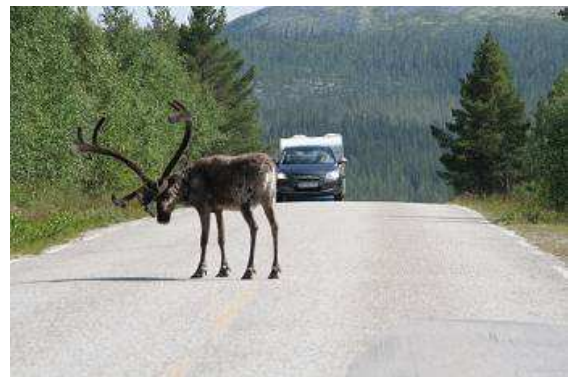
Elche ohne Vorwarnung

restlichen norwegischen Kronen noch in Benzin umgesetzt. In der Nähe des Ortes Osterfassen sehen wir auf einmal einen Elch, noch ziemlich jung, wir glauben es kaum, sonst sieht man die Tiere bestenfalls im Zoo oder auf den zahlreichen Schildern, die vor deren mächtigen Körpern und einem Zusammenprall damit warnen. Aber jetzt lebhaftig ein Elch, schnell den Foto raus und Bilder gemacht was die Kamera hergibt. Nur einige hundert Meter weiter noch ein Elch, der lässt sich von unserer Anwesenheit gar nicht stören, grast das ihm wohl schmeckende Grün am Straßenrand. Wir können aussteigen, fotografieren, Elch mit Wartburg, Elch ohne Wartburg, Elch mit Kopf oben, Elch mit Kopf unten, Elch beim stehen, Elch beim gehen. Und das alles ohne ein Hinweisschild, das die Gefahr besteht, es könnten Elche kommen! Ein paar Kilometer weiter treffen wir noch einmal zwei Tiere, an einer Futterkrippe vor dem Ort sind noch einmal einige Jungtiere zu sehen.