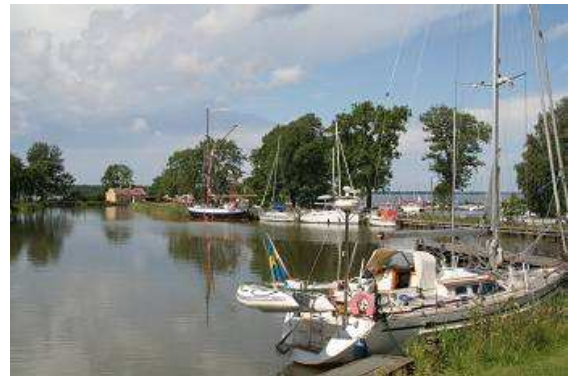
Am Götakanal bei Sjötorp

Stolz Schwedens. Mit einer Länge von 385 Kilometern verbindet er die Städte Göteborg und Mem an der Ostsee. Auf dem Weg sind 65 Schleusen zu passieren, die Seen Vännern und Vättern zu durchqueren und von Mem an der Ostküste Schwedens führt der Weg noch ein Stück durch die Ostsee bis zur schwedischen Hauptstadt. Der Kanal wurde mit einem riesigen Aufwand an Maschinen, Menschen, Schaufeln und Spaten 1832 fertig gestellt. Planer und Oberbauleiter waren Freiherr Baltzar Bogislaus von Platen und Daniel Thunberg. Früher war der Kanal ein wichtiger Transportweg für die Industrie, heutzutage tummeln sich massenhaft Freizeitkapitäne auf dieser landschaftlich sehr schönen Wasserstraße.